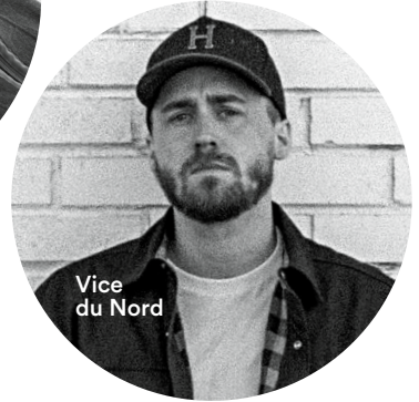
Vice du Nord