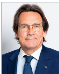
PIERRE KARL PÉLADEAU

Président et chef de la direction de Québecor